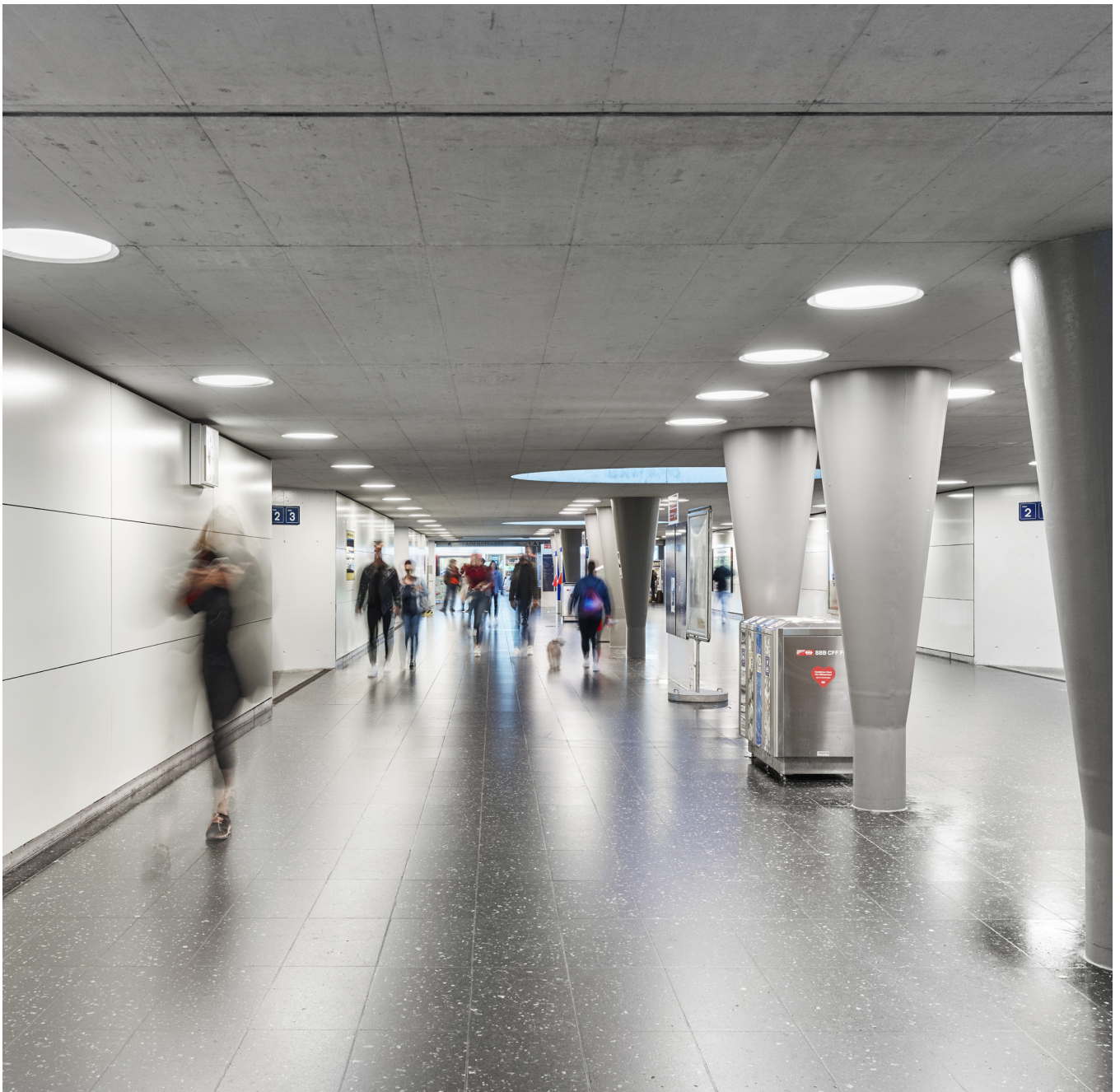
Hauptunterführung | Bahnhof Baden

Mit kleinen gezielten Massnahmen konnte in Bereichen mit hohem Personenfluss eine grosse Wirkung erreicht werden.