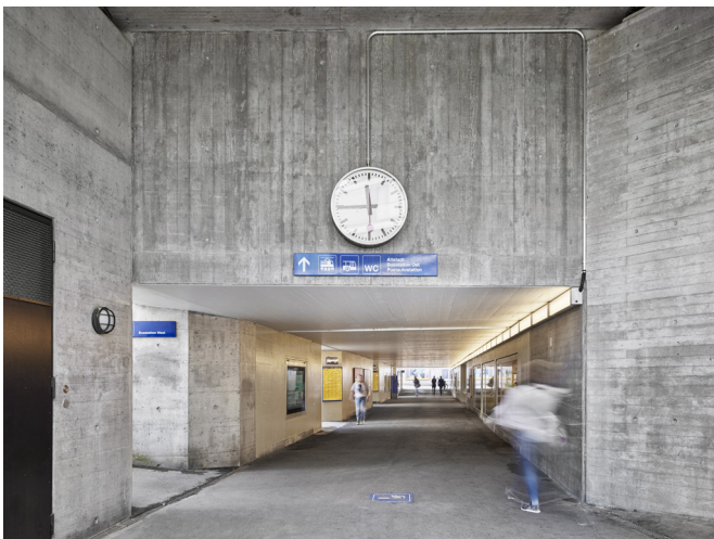
Personenunterführung Sterk | Bahnhof Baden