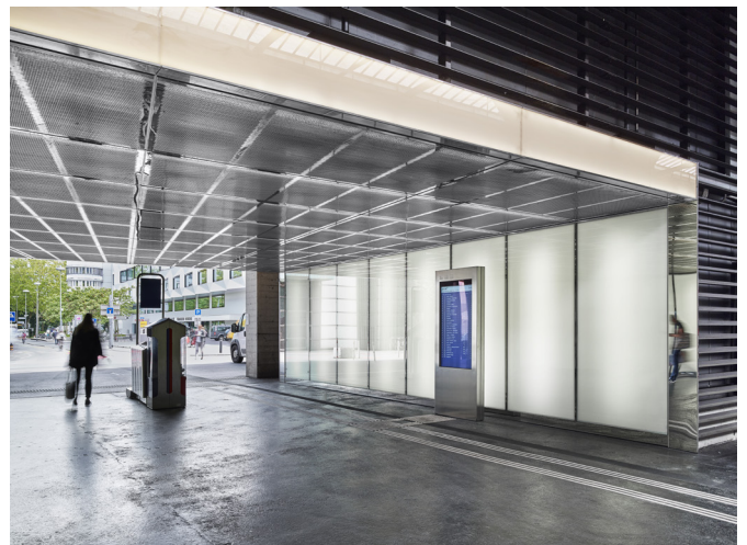
Ausgang Universität | Bahnhof Luzern