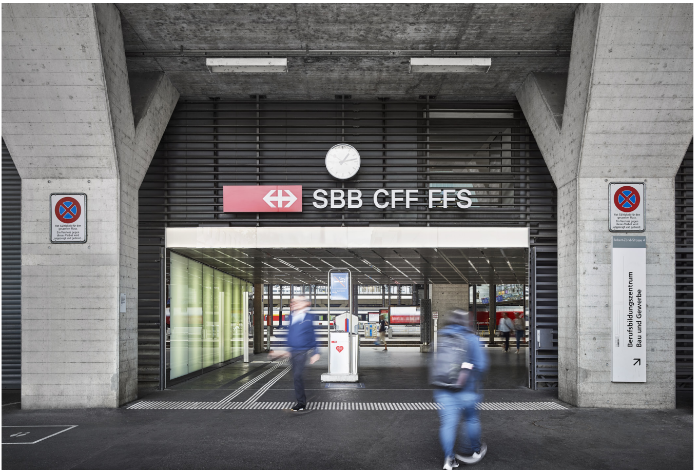
Ausgang Universität | Bahnhof Luzern