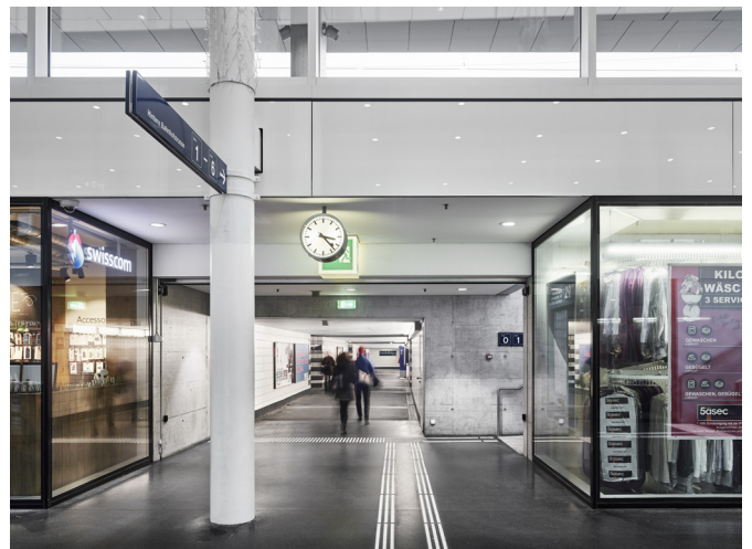
Personenunterführung West | Bahnhof Aarau