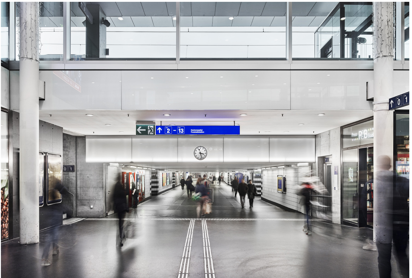
Personenunterführung Ost | Bahnhof Aarau