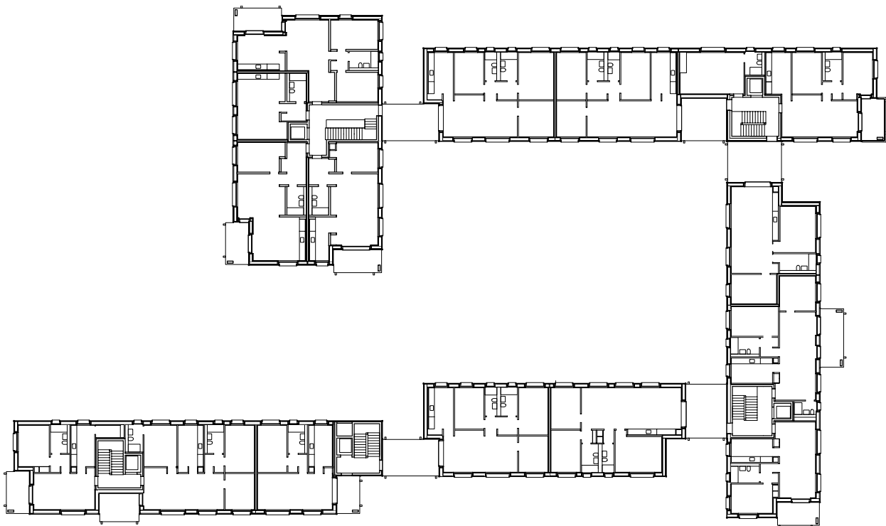
Grundriss 1. Obergeschoss