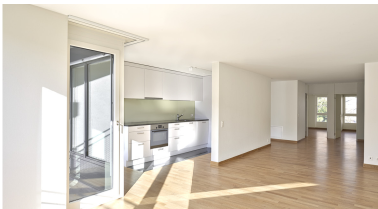
31/2 Zimmer-Wohnung Hof- und Strassenseite