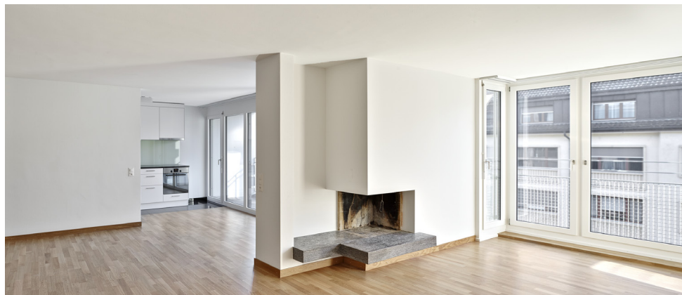
21/2 Zimmer-Wohnung Strassenseite