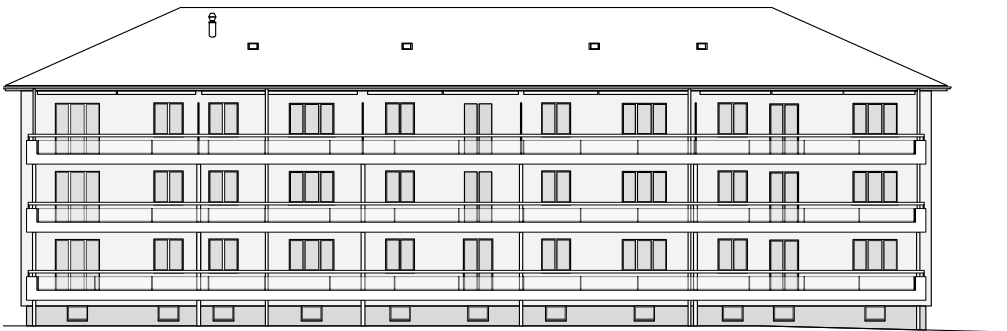
Fassadenansicht Süd M 1:300

werk 1 | architekten und planer ag | dipl. Architekten ETH/SIA | www.werk1.ch Leberngasse 15 | CH-4600 Olten | Tel 062 207 50 50 | Fax 062 207 50 59 Missionsstrasse 8 | CH-4055 Basel | Tel 061 281 50 50 | Fax 061 261 46 69