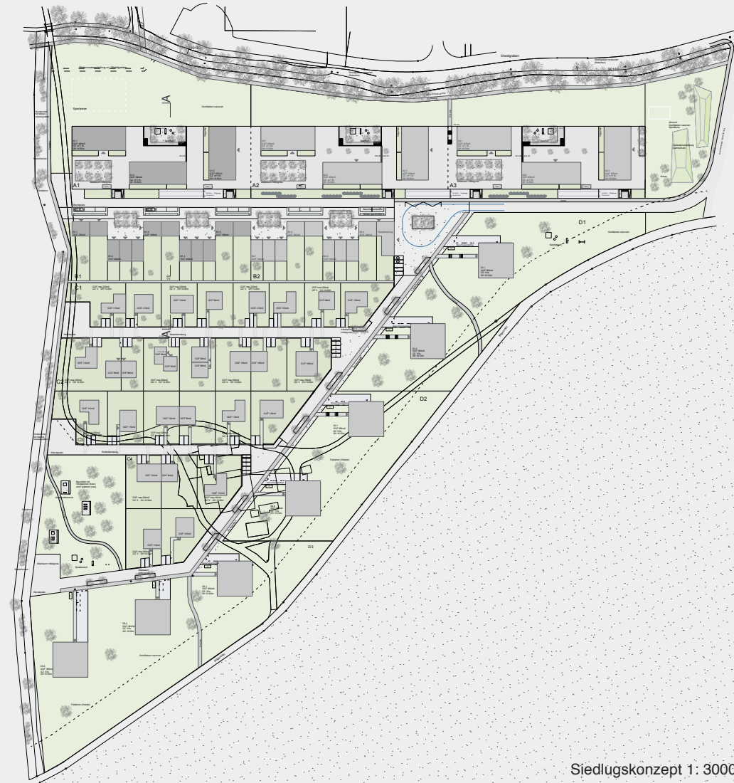
Siedlungskonzept 1: 3000

Das Planungsgebiet Bornfeld-Erlimatt wird durch einen Nahwärmeverbund für Raumheizungen und Warmwasser erschlossen. Es besteht über alle Zonen eine Anschlusspflicht an diesen Nahwärmeverbund. Dieser wird durch den Energieversorger im Sinne eines Contracting betrieben. Die Energieerzeugung ist, mindestens während der Heizperiode, über eine mit Erdgas betriebene Wärme-Kraft-Kopplungsanlage gewährleistet. Sämtliche Gebäude müssen den Minergie-Standard erfüllen.