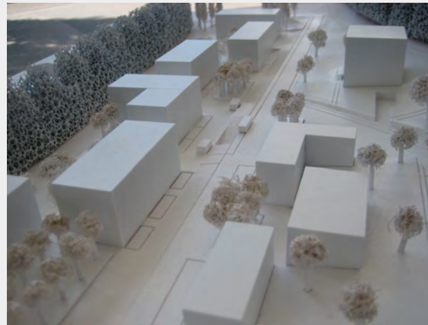
Modellblick aus Südwesten