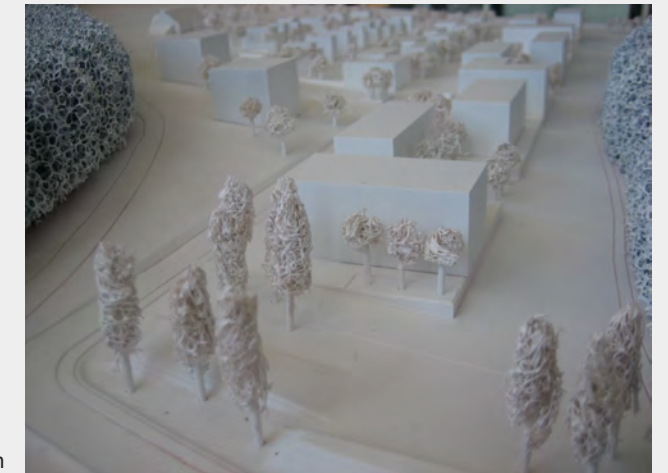
Modellblick aus Norden