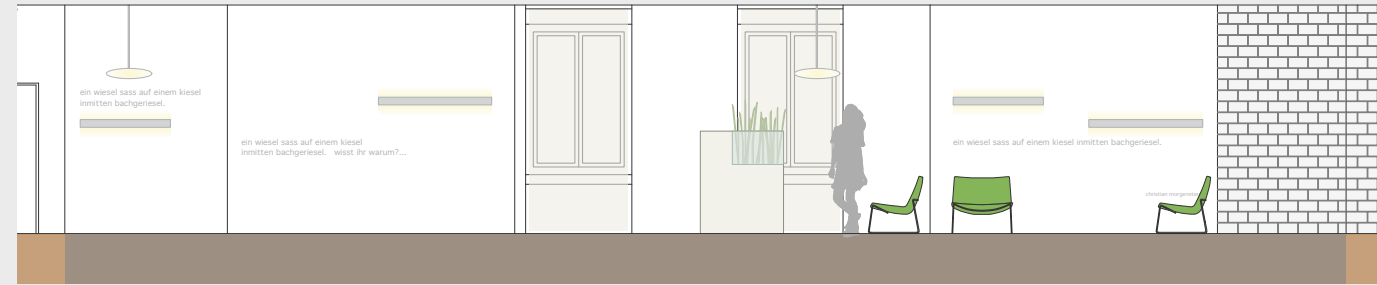
360° Ansicht des Wartezimmers

Im Jahre 1981 wurde durch den Oltnen Architekten Roland Wälchli eine Zahnarzt-praxis in ein «Chorherrenhaus» eingebaut. Die Bauherrschaft wünschte nun nach fast 30-jähriger Tätigkeit ein Facelifting im Bereich Empfang/Warten und Büros. Die Architekten hatten die Aufgabe, die ursprüngliche Architektur mit ihrem prägenden Stil, durch die Verwendung von Kalksandstein-Sichtmauerwerk, nicht zu verändern, aber trotzdem den Eindruck zu vermitteln, dass mit gezielten Eingriffen eine Symbiose zwischen Alt und Neu entsteht. Diese Herausforderung wurde angenommen und die Boden-, Wand- und Decken-texturen sowie die künstliche Beleuchtung umgestaltet und das Mobiliar ersetzt. Nach nur 2.5 Wochen Umbauzeit konnte die Praxis der Bauherrschaft zur Wiederverwendung übergeben werden.