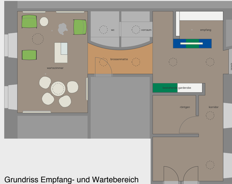
Grundriss Empfang- und Wartebereich